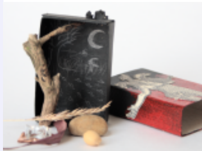
Nachtmahr Box No. 11/12

Gerade erst fertig geworden ist meine Nachtmahr-Box, eine von mir umgearbeitete Streichholzschachtel in einer limitierten Auflage von 12. Die Materialien in der Schachtel sowie die Schachtel selbst können benutzt werden, um eine Installation gegen den Nachtmahr auf dem Nachttisch zu erstellen. Ein dazu passender Bannspruch in original rheinischem Dialekt ist auf die Rückseite der Schachtel geschrieben, so dass er bei Bedarf im Bett liegend abgelesen werden kann.