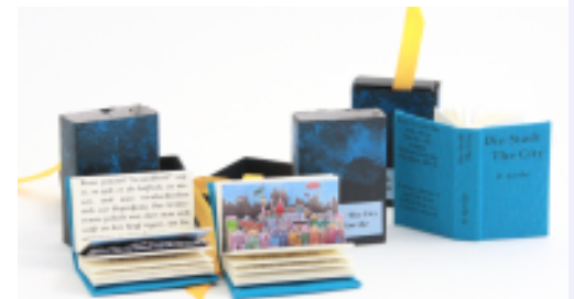
Die Stadt / The City

Mein Buch Die Stadt / The City war im Juni für eine Woche in Liverpool in der Zentralbibliothek zu sehen. Zu meiner Freude war mein kleines Pop-up bei den Besuchern recht beliebt und hat sich überraschend gut verkauft, so dass nun deutlich über die Hälfte der Auflage verkauft ist.